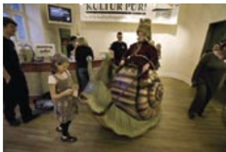
Eingangsbereich, Kasse in Pforzheim